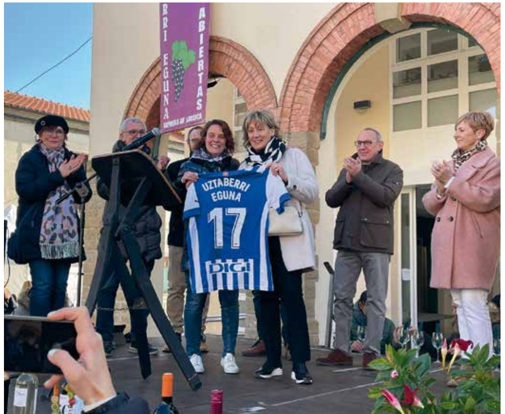
Uztaberri Eguna se apoya en las bodegas participantes, este año diez, que abren sus puertas y explican lo que hacen, sus tipos de vino y su filosofía.