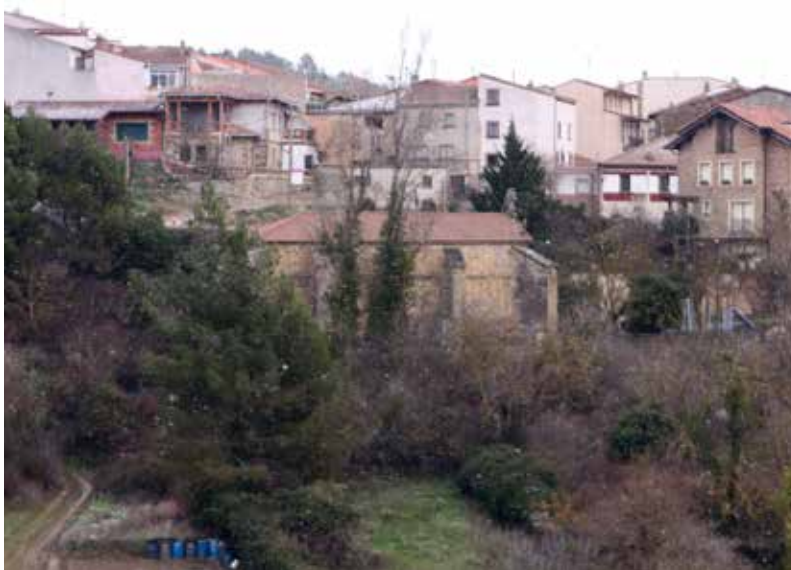
Navaridas tiene su corazón en la escondida ermita de San Juan de Ortega.

Puedes escuchar las entrevistas al completo en nuestra web