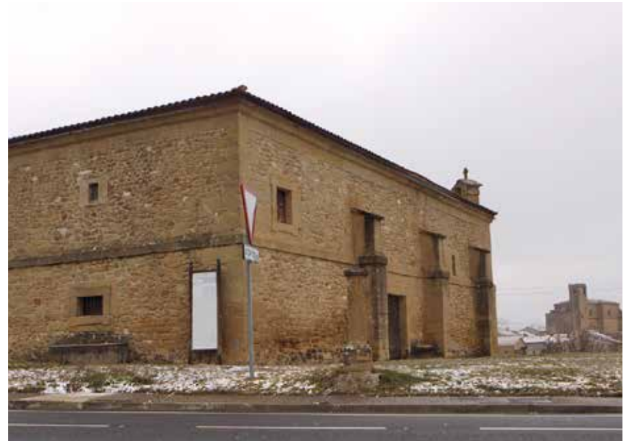
La Virgen del Valle tiene sus citas en Samaniego, aunque también haya sido lugar para obras de teatro.