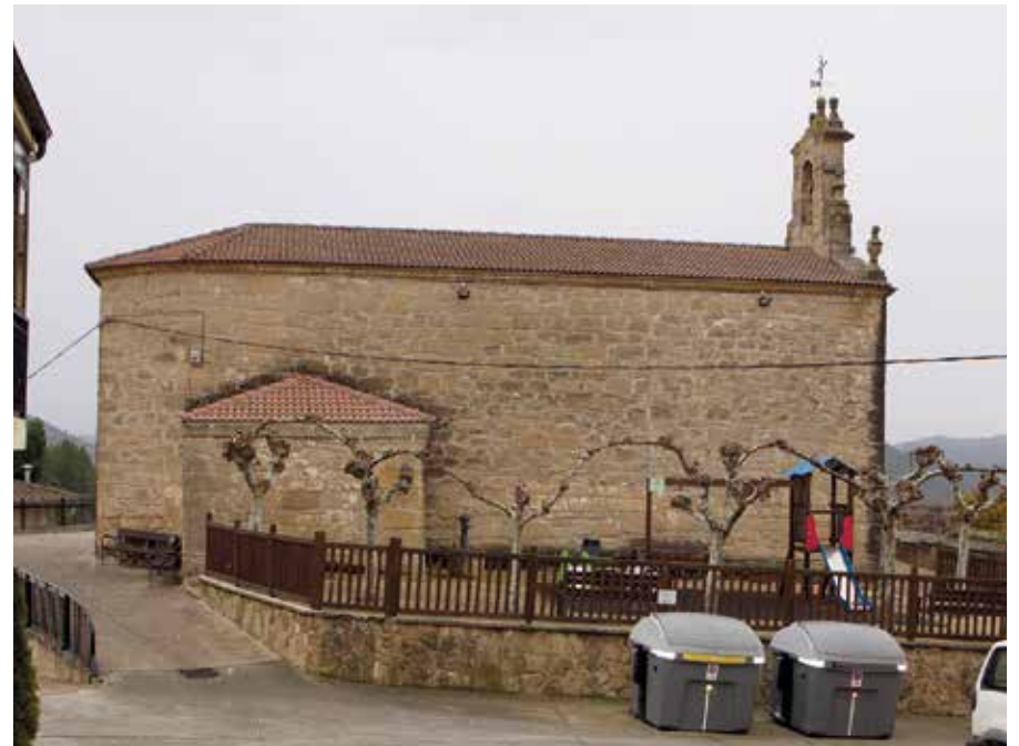
En Baños de Ebro se desarrolla la novena de San Cristóbal cada mes de julio.