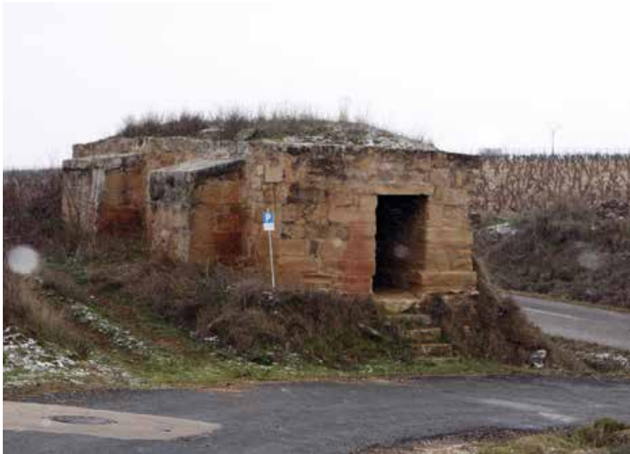
En la salida de Elciego hacia Baños de Ebro nos encontramos con lo que fue la ermita de la Santa Cruz.