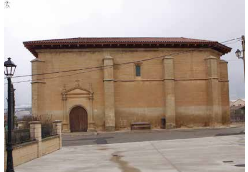
En Párganos la ermita de Santiago ha vivido diversas historias y varias transformaciones. Ahora es propiedad de una bodega y tiene un gran salón polivalente.