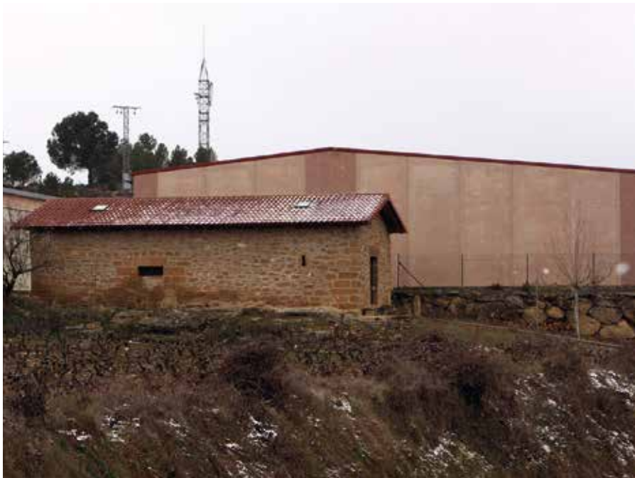
En Villabuena se ha recuperado la ermita de San Roque.