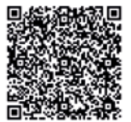
LA CHARLA COMPLETA EN NUESTRA WEB

Kripan espera además la llegada del mes de mayo para celebrar dos de sus citas más tradicionales, la celebración de San Isidro, el 15 de mayo, y la romería a San Tirso, que este año será el sábado 17 de mayo.