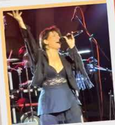
Gran Tributo a Mecano