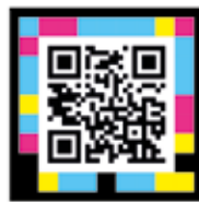
LA CHARLA COMPLETA EN NUESTRA WEB

En este repaso no puede faltar una visita a las obras de construcción de la piscina. Trabajos que avanzan a buen ritmo y que, según lo esperado, concluirán este verano. Una situación que deja varios meses de margen al equipo municipal para preparar la puesta a punto de la instalación de cara al verano de 2026.